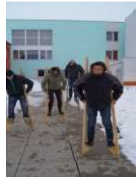
Walking with stilts