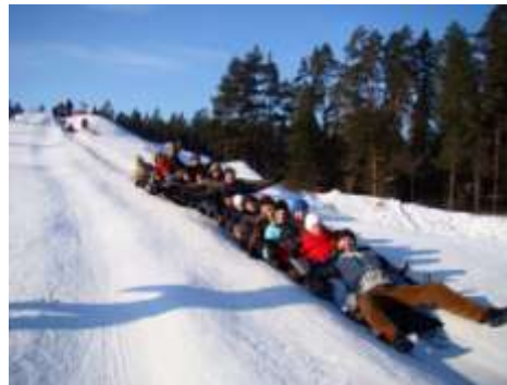
Placing on the hill with the sled