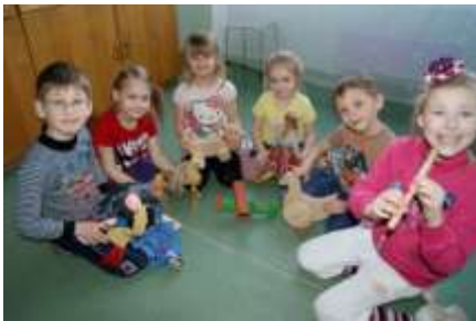
(At first wooden toys)

The games are a great way for deeping latvian feelings, enrichment of Latvian language, developing sence of rhythm and musical, strengthening of mutual relationship and for funny.