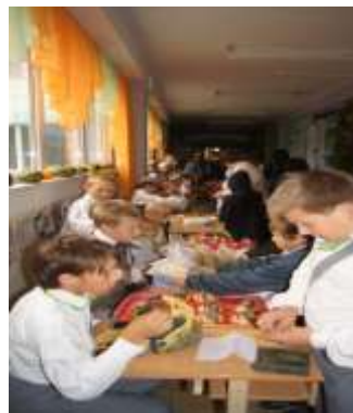
Mikelis Day trade fair