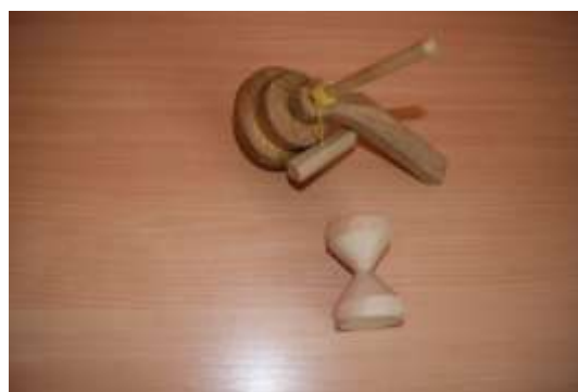
Wooden spinning top