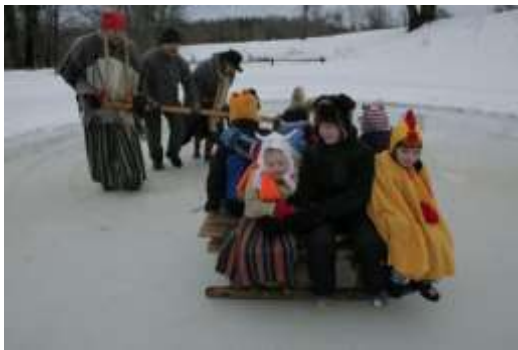
Rotation of the wheel

Always was popular sledge rides, spinning with wheel, then suggestions said will be good harvest.