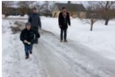
Attractions with eggs