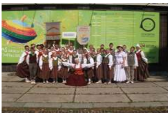
X Latvian School Youth Song and Dance Celebration logo

Unlimited number of players.Player tune spinn, Winner is who turn spinner the longer.